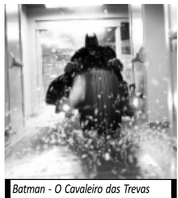
Batman - O Cavaleiro das Trevas