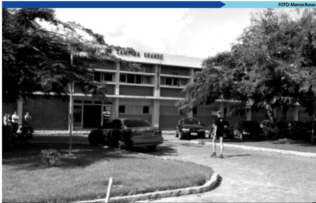
A Universidade Federal de Campina continua utilizando as notas do Enem para classificação de candidatos

UFPB - O Processo Seletivo Seriado 2012 da Universidade Federal da Paraíba - UFPB já registrou 34.545 pré-inscrições, conforme balanço parcial da Comissão Permanente do Vestibular - Coperve