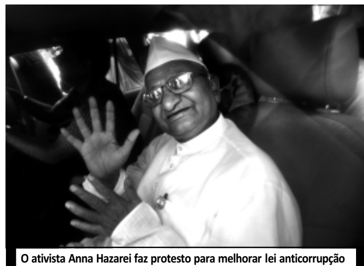
O ativista Anna Hazare faz protesto para melhorar lei anticorrupção

permaneceria preso até que seu protesto fosse liberado. A polícia vinha insistindo que o ativista de 74 anos de idade fizesse greve de fome por apenas três dias.