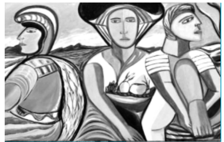
OBRAS DE MIRABEAU NA GAMELA