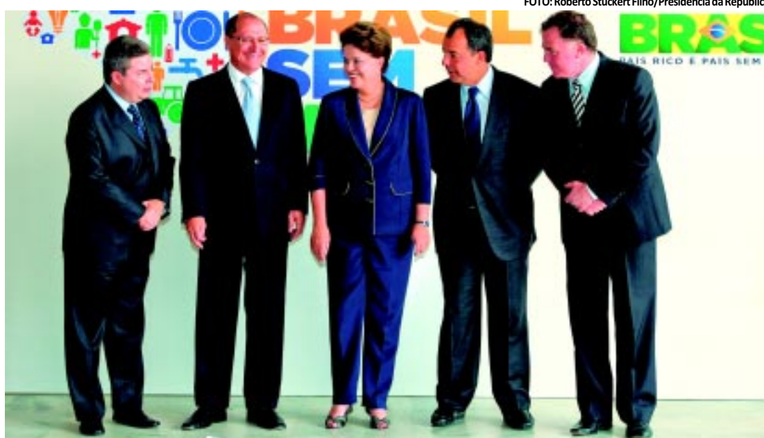
Dilma posa para foto com governadores do Sudeste na chegada à pactuação do Plano Brasil sem Miséria

Em outra denúncia, foi revelado que Rossi viajou num jatinho da Ourofino Agronegócio, empresa que vende vacinas para a febre aftosa desde 2010 e tem outros negócios com o Governo Federal.