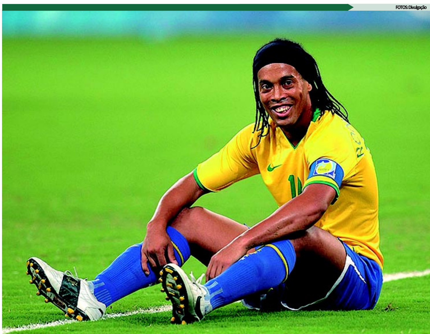
Após grandes atuações pelo Flamengo, Ronaldinho foi convocado pelo técnico Mano Menezes para o amistoso contra Gana no dia 5 de setembro

A apresentação dos jogadores da Seleção está prevista para os dias 30 e 31 de agosto. Segundo Mano Menezes, os jogadores vão treinar no dia 1º, 2, 3 e 4 de setembro antes do duelo diante dos africanos.