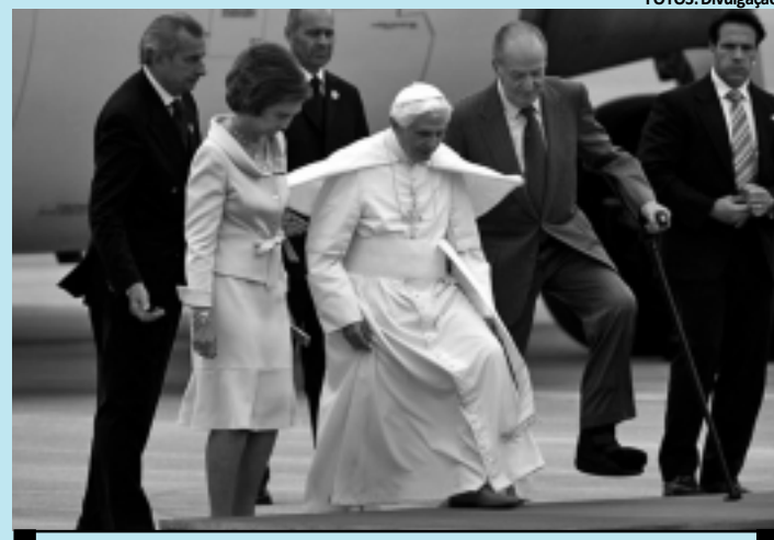
O papa Bento XVI chegou ontem no país para visita de quatro dias

Em seu primeiro discurso, proferido em um espanhol perfeito, o pontífice lembrou a crise econômica que sacode a Europa e particular-