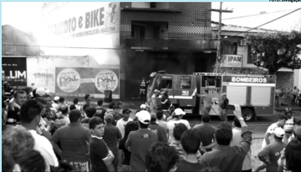
Cerca de 40% do fornecimento de energia elétrica da cidade foi paralisado devido às chamas