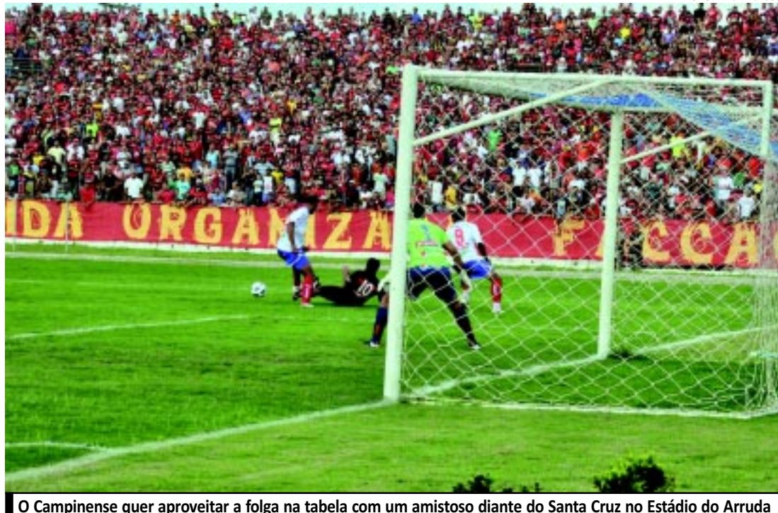
O Campinense quer aproveitar a folga na tabela com um amistoso diante do Santa Cruz no Estádio do Arruda