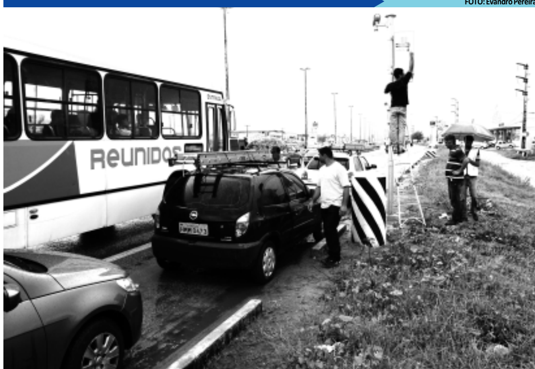
Este ano o PNCV investirá, na Paraíba, R$ 50,3 milhões para instalar e operar 56 equipamentos nas BRs