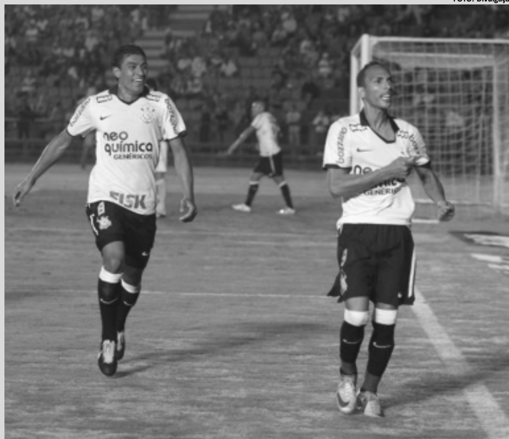
Liedson marcou o 3º gol do Corinthians na virada de 3 a 2 sobre o Atlético Mineiro em Minas Gerais