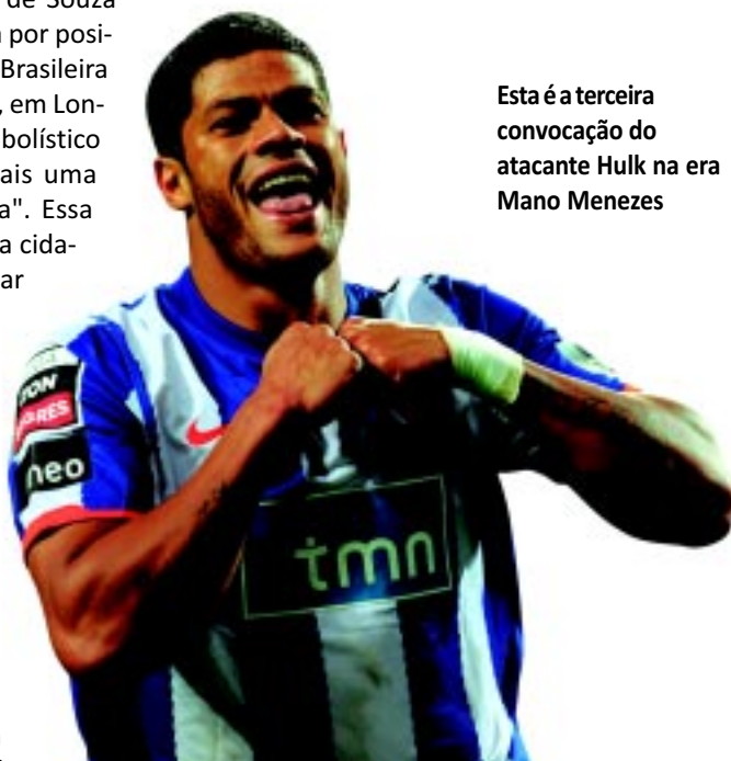
Esta é a terceira convocação do atacante Hulk na era Mano Menezes

Hulk é paraibano de Campina Grande, mas nunca jogou futebol no Estado. Sua carreira começou no Vitória da Bahia em 2004 de onde saiu para o exterior. Sua primeira transferência para fora do país foi para o Japão, onde jogou pelo Kawasaki Frontale, o Consadole Sapporo